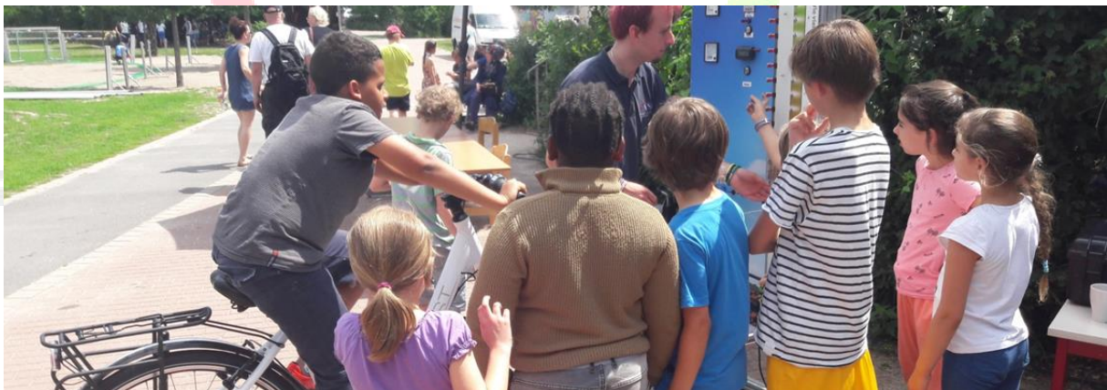
Aktionsstände zum Biesalski-Cup der Biesalski-Schule

Wir widmen uns gemeinsam einem selbstgewählten Schulprojekt. Das elan-Team liefert Input und Unterstützung in Form von Daten, Recherchen, Erklärungen, Material, etc. Themen könnten bspw. sein: Einführen einer Mülltrennung, Plakate zum Energieverbrauch der Schule und Schul-Ranking basteln, Durchführung eines klimagischen Turniers, eine Klima-AG gründen, einen Carrot-Mob durchführen, Thermostatköpfe tauschen, usw.